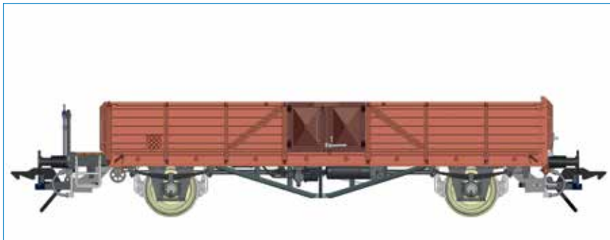
Omm 32 (Linz), mit Bremserbühne, DB - Art. Nr. 42131-01