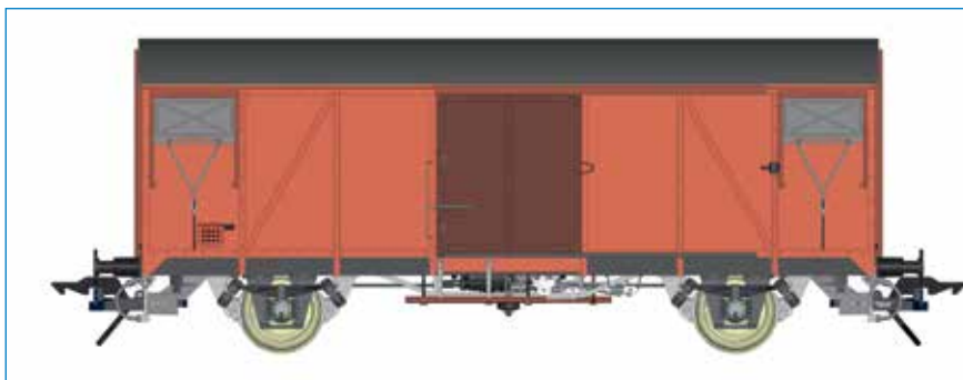
Gms 54 Gedeckter Güterwagen, DB - Art. Nr. 42234-01