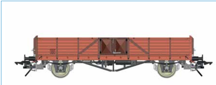
Omm 32 (Linz), DB - Art. Nr. 42130-01