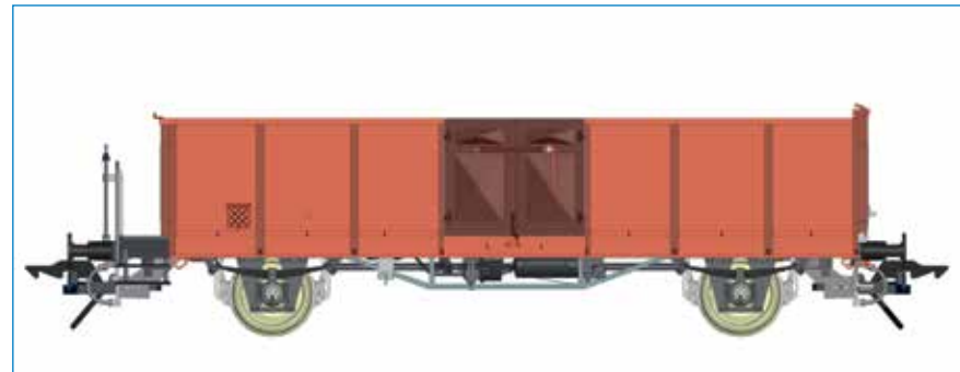
Omm 42 mit Bremserbühne - DB - Art. Nr. 42137-01