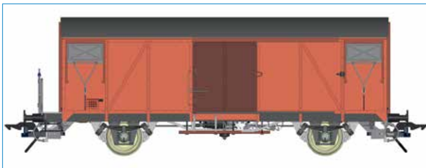
Gms 54 Gedeckter Güterwagen mit Bremserbühne, DB - Art. Nr. 42235-01