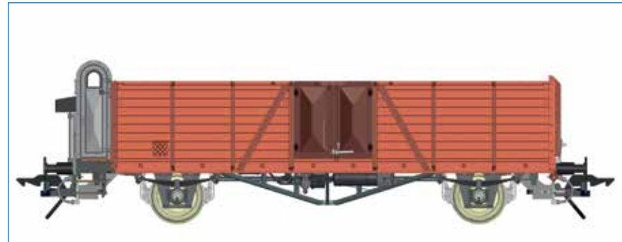
Omm 33 (Villach) mit Bremserhaus, DB - Art. Nr. 42134-01